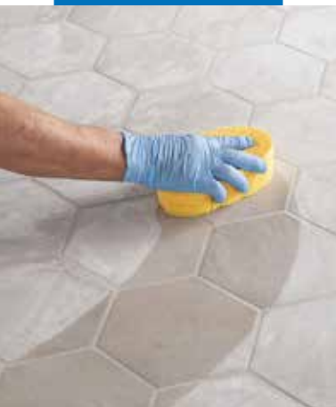
Pulizia e finitura delle fughe con spugna di cellulosa dura