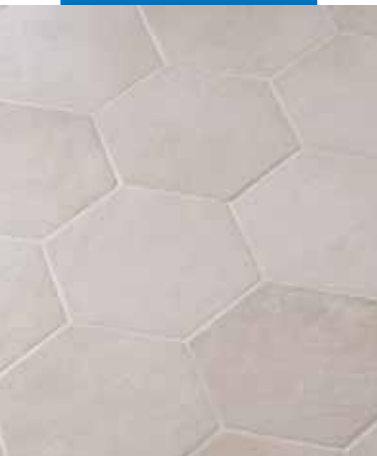
Pavimentazione stuccata con Keracolor FF

in sottofondi non asciutti o non adeguatamente protetti dall'umidità di risalita.