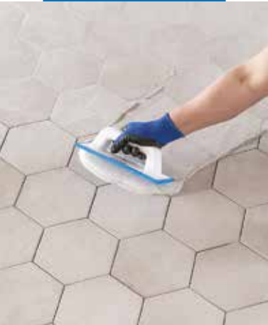
Stesura di Keracolor FF con spatola MAPEI